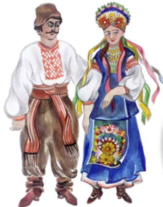
Ukrajinský lidový kroj

Kde leží Česká republika a kde Ukrajina?